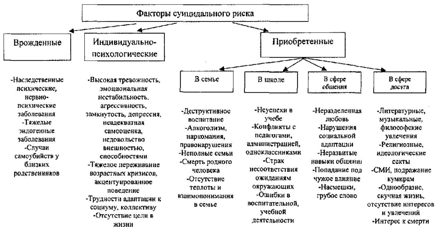
Рис.1. Факторы суицидального риска